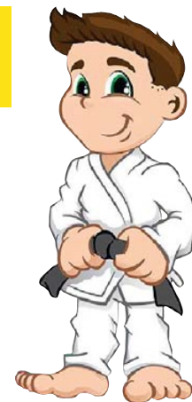
TABLE N° .....