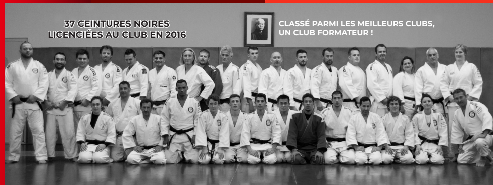
37 CEINTURES NOIRES LICENCIÉES AU CLUB EN 2016